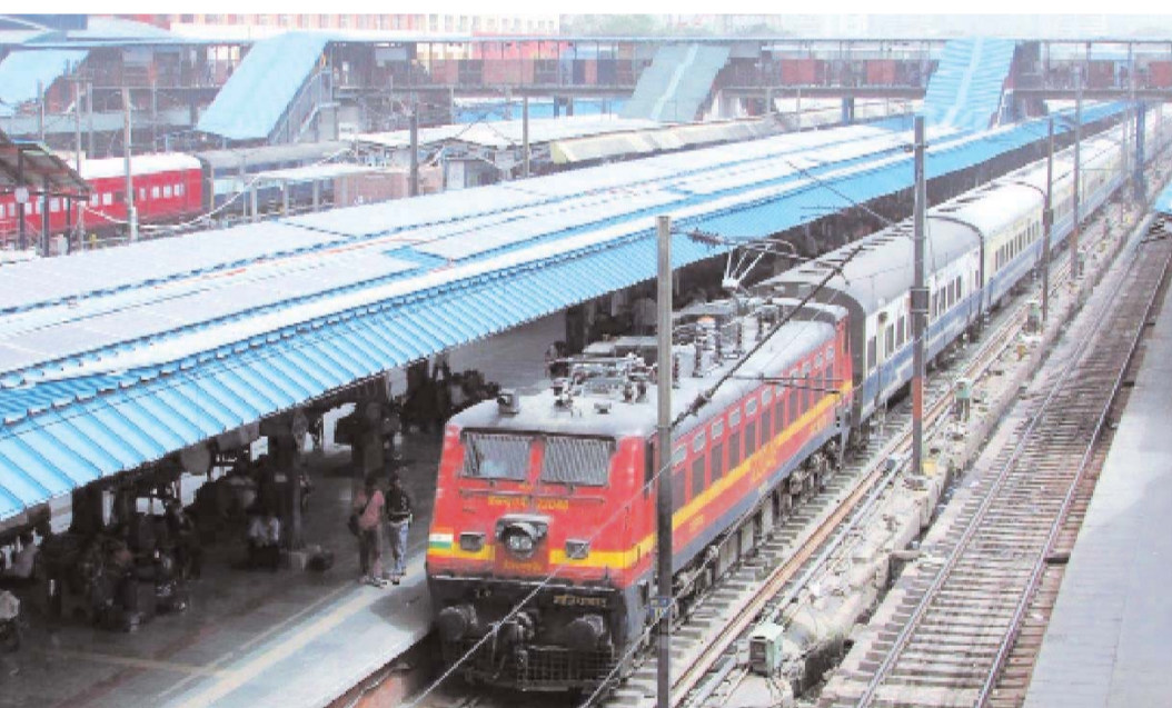
రూపకల్పన లాంటి పనులను రైల్వే శాఖ చూసుకుంటుంది. రైలు మార్గం నిర్మాణం, నిధుల సమీకరణతోపాటు 45 ఏకరాలకు ఈ రైలు మార్గ నిర్వహణ బాధ్యతను ప్రయివేట్ సంస్థకు అప్పగిస్తారు. రైల్వే శాఖ వీసీపీ మోడల్కు సంబంధించి ప్రతిపాదనలను రూపొందించిన తర్వాత బెండర్లను ప్రారంభిస్తారు. ఈ కొత్త రైల్వే లైన్ అందుబాటులోకి వస్తే.. మారుమూల గిరిజన ప్రాంతాలకు రైల్వే కనెక్టివిటీ లభిస్తుంది. భద్రాచలం నుంచి రామగుండం చేరుకోవడం సులభం అవుతుంది. ఒడిశాలోని మల్లనగిరి నుంచి భద్రాచలం- పాండరంగాపురం వరకు 186 కిలోమీటర్ల మేర కొత్త రైల్వే లైన్కు కూడా కేంద్ర కేబినెట్ ఆమోదం తెలిపిన సంగతి తెలిసిందే. ఈ లైన్కు సంబంధించి ఫైనల్ లోకేషన్ సర్వే పూర్తయ్యింది. అలాగే భద్రాచలం రోడ్ (కొత్తగూడెం), డోర్నాలకో స్టేషన్ల మధ్య దబల్ లైన్ పనులు జరుగుతున్నాయి. దీంతోపాటు భద్రాచలం రోడ్ నుంచి ఆంధ్రాలోని కొప్పుల వరకు రైల్వే లైన్ను ఏర్పాటు చేయాలని నిర్ణయించారు. ఇప్పటికే తెలంగాణలోని సత్తుపల్లి వరకు 56 కిలోమీటర్ల మేర రైల్వే లైన్ ఏర్పాటు చేశారు. ఈ మార్గాన్ని బోగ్గు రవాణా కోసం ఉపయోగిస్తున్నారు. సత్తుపల్లి నుంచి

ఇక రణమే... భగీరథ్ చిచ్చు.. పాండరాబాద్ : తెలంగాణలో మూడు ప్రధాన పార్టీలున్నాయి. అయితే బీజేపీ ? బీఆర్ఎస్ ఒక్కటేనని అధికార కాంగ్రెస్ పార్టీ మొదటి నుంచీ ఆరోపిస్తూ వస్తోంది. ఆ రెండు పార్టీల మధ్య తెరవెనుక పోటీ ఉందని చెప్పా వచ్చింది. అయితే ఇప్పుడు అలాంటి ఊహాగానాలకు తెరవదింది. బండి భగీరథ్ కేసు వ్యవహారం ఆ రెండు పార్టీల మధ్య గ్యాప్ పెంచేసింది. భగీరథ్పై సమాదైన కేసు, ఆ తర్వాత చోటాచేసుకున్న పరిణామాలు రాష్ట్రంలో పోత్తుల సమీకరణాలను మార్చేసిన్నట్లు అర్థమవుతోంది. ఢిల్లీ పెద్దలపై ఈగ వాలనివ్వకుండా కేవలం రాష్ట్ర స్థాయి నేతలనే టార్గెట్ చేస్తూ వస్తున్న గులాబీ బానులు.. ఒక్కసారిగా రూల్ మార్చారు. శాజా పరిణామాలు తెలంగాణ వీరం కోసం పక్కా త్రిమూఖ పోరు ఖాయమనే విషయం స్పష్టమైంది. బండి భగీరథ్ ఉదంతాన్ని ఒక సాధారణ బీగ్ ఇన్ఫ్యూగా పదిలేయడానికి బీఆర్ఎస్ అన్నలు సిద్ధపడలేదు. దొరికిన ఆస్రాన్ని పడునుపెట్టి కమలాగుల గుండెల్లో దింపింది. బండి సంజయ్ను కేంద్ర మంత్రిమండలి నుంచి బర్తర్న చేయాలంటూ న్యాయంగా కేటీఆర్ రంగంలోకి దిగడం, రాష్ట్రవ్యాప్తంగా గులాబీ కేడర్ రోడ్లపైకి వచ్చి నిరసనలతో హోరెత్తించడం చూసి బీజేపీ మైండ్ బ్లాక్ అయింది. తమతో సయోధ్య గియోర్లు లాంటి ముచ్చటలే లేవని,