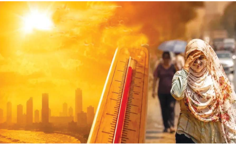
జనాలకు పలు జిల్లాల్లో రాత్రి కురిసిన వర్షం ఉపశమనం కలిగింది. ఇవాళ కూడా పలు జిల్లాల్లో డ్రోజ్ ప్రభావంతో వర్షాలు కురిసే అవకాశం ఉందని వాతావరణ శాఖ స్పష్టం చేసింది. దేశ వ్యాప్తంగా సమాదవుతున్న భారీ ఉష్ణోగ్రతల నేపథ్యంలో ప్రజలకు వాతావరణ శాఖ కీలక హెచ్చరికలు జారీ చేసింది. మధ్యాహ్నం 11 గంటల నుండి సాయంత్రం 4 గంటల వరకు ప్రజలు ప్రయాణాలను వాయిదా వేసుకోవాలని, అత్యవసరమైతే తప్ప బయటకు రావద్దని హెచ్చరించింది. ముఖ్యంగా వృద్ధులు, గర్భిణీలు, చిన్న పిల్లలు జాగ్రత్తగా ఉండాలి. ఓఆర్ఎస్, లవణాలు, మజ్జిగ, కొబ్బరి నీళ్లు ఎక్కువగా తీసుకోవడం మంచిదని పేర్కొంది.

ఇక భారీ ఉష్ణోగ్రతల నేపథ్యంలో ఉత్తర తెలంగాణ జిల్లాల్లో తోపాటు నల్గొండ ఖమ్మం జిల్లాల్లో రెడ్ అల్ట్రా జారి చేసింది వాతావరణ శాఖ. అలాగే రాష్ట్రంలో మరి కోస్తా ఆరెంజ్ అల్ట్రా జారి చేసింది. అయితే 45 డిగ్రీల ఉష్ణోగ్రతలు దాటితే వర్షావరణ సమతుల్యత దెబ్బతినే అవకాశం ఉందని వాతావరణ శాఖ హెచ్చరిస్తోంది. రాష్ట్రవ్యాప్తంగా పలు జిల్లాల్లో ఒక్కరోజులోనే రెండు సుంచి మారు డిగ్రీలు ఉష్ణోగ్రతలు పెరిగినట్టు తెలిపింది. అటు ఆంధ్రప్రదేశ్లోనూ తెలంగాణ తరహా వాతావరణ పరిస్థితులే కనిపిస్తున్నాయి. అక్కడ కూడా రాష్ట్ర వ్యాప్తంగా పలు జిల్లాల్లో రికార్డు స్థాయిలో ఉష్ణోగ్రతల సమాదవుతున్నాయి. రాష్ట్రవ్యాప్తంగా వగరీ ఉష్ణోగ్రతలు 44 నుండి 47 వరకు సమాదయ్యే అవకాశం ఉంది. ఇక గురువారం వల్లూరు జిల్లా పిడుగురాళ్లలో ఈ సీజన్లోనే అత్యధికంగా ఉష్ణోగ్రతలు సమాదైనట్టు తెలుస్తోంది. ఈ నేపథ్యంలో ఏలూరు, పశ్చిమ గోదావరి, తూర్పు గోదావరి, డాక్టర్ బి.ఆర్. అంబేద్కర్ కోనసీమ, ఎన్టీఆర్, కృష్ణా, గుంటూరు, వల్లూరు, బాపట్ల, ప్రకాశం, నెల్లూరు జిల్లాలకు వాతావరణ శాఖ ఆరెంజ్ అల్ట్రా జారి చేసింది. ఈ ప్రాంతాల్లో తీవ్ర వడగాల్లులు వీచే అవకాశం ఉందని తెలిపింది. ఇదిలా ఉండడం అంతా ఉక్కపోతతో ఉక్కిరి బిక్కిరి అయిన