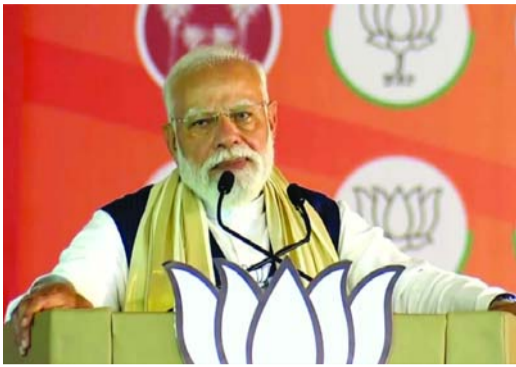
ప్రభుత్వ నిష్ఠులను కౌంటర్ డౌన్ ప్రారంభమైంది. కేరళలో మొదటిసారిగా బీజేపీ-ఎన్డీఏ ప్రభుత్వం అధికారంలోకి రాబోతోంది.

కేరళలో ఎల్డీఎఫ్ ప్రభుత్వ నిష్ఠులను కౌంటర్ డౌన్ ప్రారంభమైంది. ప్రధాని నరేంద్ర మోదీ అన్నారు. ఎన్నికల తర్వాత కేరళలో అతిపెద్ద మార్పు జరుగుతుందని, బీజేపీ నేతృత్వంలోని ఎన్డీఏ అధికారంలోకి వస్తుందని ధీమా వ్యక్తం చేశారు. కేరళ అసెంబ్లీ ఎన్నికల ప్రచారంలో భాగంగా పతనం అవుతున్న బీజేపీని తిరువళ్లూరు నిర్వహించిన బహిరంగ సభలో ప్రధాని మాట్లాడారు. కేరళ అభివృద్ధికి అవినీతి, మతతత్వం రెండు అతిపెద్ద అవరోధాలుని ఈ సందర్భంగా చెప్పారు. శబరి రైలు ప్రాజెక్టును ఎల్డీఎఫ్ ప్రభుత్వం అణగారినప్పుడు తిరువళ్లూరు ప్రభుత్వం తీవ్రంగా నష్టపోయారని ప్రధాని ఆరోపించారు. కేరళకు అపారమైన సామర్థ్యం ఉన్నప్పటికీ, అభివృద్ధి పరుగులో ఇతర రాష్ట్రాల కంటే వెనుకబడి ఉందని పేర్కొన్నారు. ఎల్డీఎఫ్, యూడీఎఫ్ ప్రభుత్వాలు సరైన శ్రద్ధ చూపకపోవడం వల్ల కేరళ గ్రామీణ ప్రాంతాల్లో మౌలిక సదుపాయాలు అధ్వాన్నంగా ఉన్నాయని మోదీ ఆరోపించారు. కేరళలో బీజేపీ డబుల్ ఇంజన్ ప్రభుత్వం అధికారంలోకి వస్తే అన్ని అడ్డంకులు తొలగిపోతాయని చెప్పారు. పశ్చిమానీయాలో పరిస్థితిపై కాంగ్రెస్ అనవసర ఆందోళనలు రేపిస్తోందని ప్రధాని విమర్శించారు. కాంగ్రెస్ నేతృత్వంలోని యూపీఏ ప్రభుత్వం కంటే ఎన్డీఏ ప్రభుత్వం కేరళ అభివృద్ధి కోసం ఐదు రెట్లు అధికంగా నిధులు ఖర్చు చేసిందని వివరించారు.