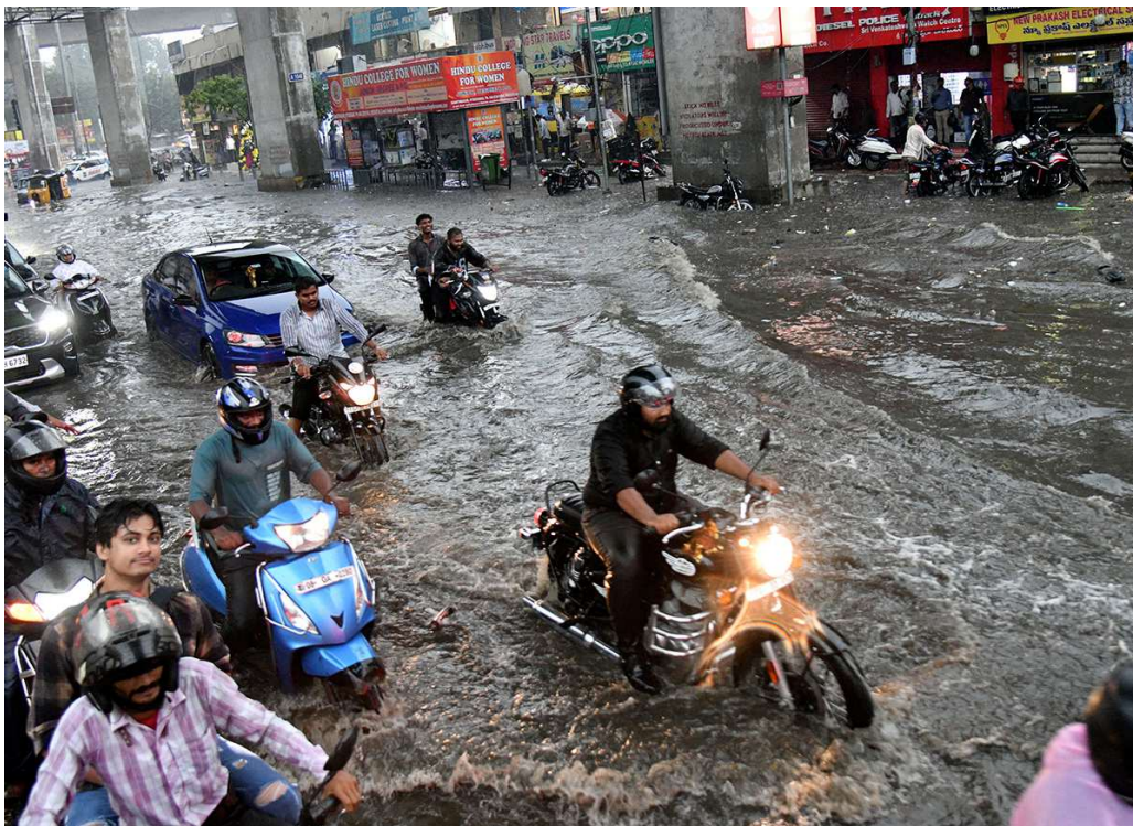
వాతావరణ శాఖ అధికారులు అంచనా వేస్తున్నారు. ఉపరితల ఆవరణ, ద్రోణీ ప్రభావంతో రాష్ట్రంలో అక్కడక్కడా మోస్తరు నుంచి భారీ వర్షాలు కురుస్తున్నాయి. ఇవి మరో రెండు రోజుల పాటు కొనసాగే అవకాశాలు కనిపిస్తున్నాయి. సోమ, మంగళవారాల్లో ఉత్తరాంధ్ర, దక్షిణ కోస్తా జిల్లాల్లో అక్కడక్కడా తేలికపాటి నుంచి మోస్తరు వర్షాలు, ఒకట్రెండు చోట్ల భారీ వర్షాలు పడే సూచనలున్నాయి. సోమ, మంగళవారాల్లో రాయలసీమలో పలుచోట్ల తేలికపాటి నుంచి మోస్తరు వానలు

నేడు, రేపు భారీ వర్షాలు.. సోమ, మంగళవారాల్లో పలు జిల్లాల్లో భారీ వర్షాలు పడే అవకాశాలున్నాయి. ములుగు, భద్రాద్రి కొత్తగూడెం, ఖమ్మం, వికారాబాద్, నంగారెడ్డి, మెదక్, కామారెడ్డి, రంగారెడ్డి, హైదరాబాద్, మేడ్చల్ మల్కాజిగిరి జిల్లాల్లో భారీ వర్షాలు కురవనున్నాయి. మిగతా ప్రాంతాల్లో తేలికపాటి నుంచి ఓ మోస్తరు వానలు పడనున్నాయి. ఇక, ఆదివారం నిర్మల్ జిల్లా అక్కాపూర్లో 11.05 సెంటీమీటర్లు, సూర్యాపేట జిల్లా ఫణిగిరిలో 8.93, ఆదిలాబాద్ జిల్లా ఇచ్చోడలో 7.28, పంగల్ జిల్లా దుగ్గిరిలో 6.70 సెంటీమీటర్ల కొద్దు వర్షపాతం నమోదైంది. హైదరాబాద్లో పాటు నారాయణపేట, రాజన్న సిరిసిల్ల, కామారెడ్డి, మెదక్, రంగారెడ్డి, భద్రాద్రి కొత్తగూడెం, నంగారెడ్డి జిల్లాల్లోనూ అక్కడక్కడ భారీ వర్షాలు కురిశాయి. మరోవైపు.. ఏపీలో రాజోయే రోజుల్లో వర్షాలు జోరందుకునే అవకాశం ఉందని