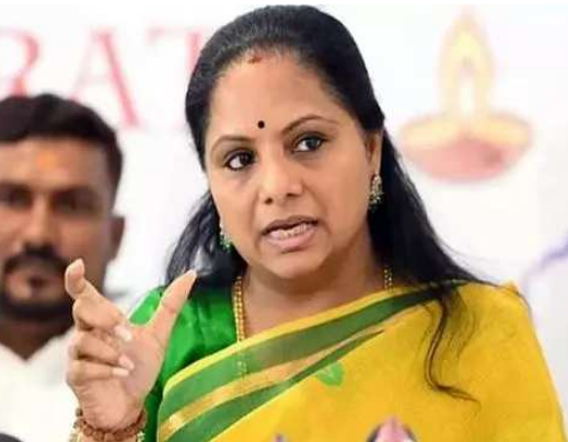
రిటైర్ చేసిన దృశ్యాల్లో కనిపించడం విశేషం. అయితే అక్కడ ఏం జరిగిందన్నది మనం చెప్పలేం కానీ, రాజకీయ చతురుడైన కేసీఆర్ మీడియా ముందు ఏం చేసినా దానికి ఒక లెక్క ఉంటుందని, మీడియా ముందు ఎవరితో మాట్లాడినా, భుజం మీద చేయి వేసినా కూడా ఒక లెక్క ఉంటుందన్న విషయం గులాబీ పార్టీలో అందరికీ తెలిసిన విషయమే. అలాంటిది సొంత కూతురు, పార్టీలో సీనియర్ మహిళా నేత అయిన కవిత దూరంగా ఉండటం, కేసీఆర్ కూడా దూరంగా ఉన్నట్లు కనిపించడం కొద్దిపాటి విషయం ఏమీ కాదు. ఇదిలా ఉంటే, కవిత అయిన నీలి రంగు కందువా కార్యక్రమాల్లో గులాబీ కందువా ఎక్కడా వేసుకోకపోవడం, బీఆర్ఎస్ కార్యకర్తలు ఎవరూ ఈ కార్యక్రమాలకు హాజరుకాకపోవడం గమనించాల్సిన మరో విషయం. కేసీఆర్ కోసం ఇందిరా పార్కు వద్ద చేసిన ధర్నాలోనూ తన సొంత సంస్థ అయిన తెలంగాణ జాగృతి కందువా కప్పకొని పాల్గొన్నారు. ఆ తర్వాత బీసీ ఉద్యమంలోనూ తన కందువాతో పాటు, బీసీ ఉద్యమానికి సూచిత అయిన నీలి రంగు కందువా కప్పకొన్నారు. ఇక తాజాగా హెచ్ఎంఎస్ కార్యక్రమం నేతలతో జరిగిన సమావేశంలోనూ హెచ్ఎంఎస్ కందువా కప్పకొని మీడియా ముందు కనిపించడం కూడా రాజకీయ సందేశంగానే చెప్పుకోవాలి. ఈ పరిణామాల్ని గమనిస్తే కవిత గులాబీ కందువాను దూరం పెట్టిందని తెలుస్తోంది. ఇక తాజా విషయానికి వస్తే, బీఆర్ఎస్ పార్టీ తనను ఒంటరి చేస్తోందని చెబుతున్న కవిత అందుకు తగ్గట్టుగా తన రాజకీయం ఏంటో చూపిస్తున్నట్లుంది. తెలంగాణలో సింగరేణి కార్యకల ప్రభావం ఎక్కువే. చాలా నియోజకవర్గాల్లో వీరి ప్రభావం కనిపిస్తుంది. బీఆర్ఎస్ అనుబంధ కార్యక్రమం సంఘమైన తెలంగాణ బొగ్గని కార్యక్రమం సంఘానికి కవిత